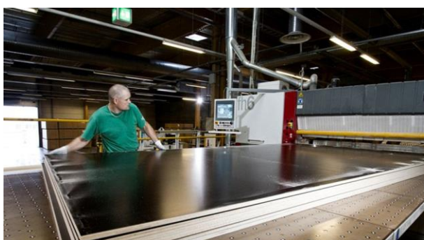
RSEZ SIA „Verems”

Rēzeknes novads atrodas pašā Latgales viducī, aptuveni 250 km no Rīgas. Novada teritoriju šķērso starptautiskas nozīmes autoceļi Rīga – Maskava, Sanktpēterburga – Varšava, kā arī starptautiskas nozīmes dzelzceļa maģistrāles šajos pašos virzienos, kas novada teritorijai piešķir ērta tranzīta koridora statusu. Rēzeknes novads atrodas netālu no Latvijas un arī visas Eiropas Savienības austrumu robežas ar Krieviju un Baltkrieviju, kas paver plašas sadarbības iespējas visās jomās.