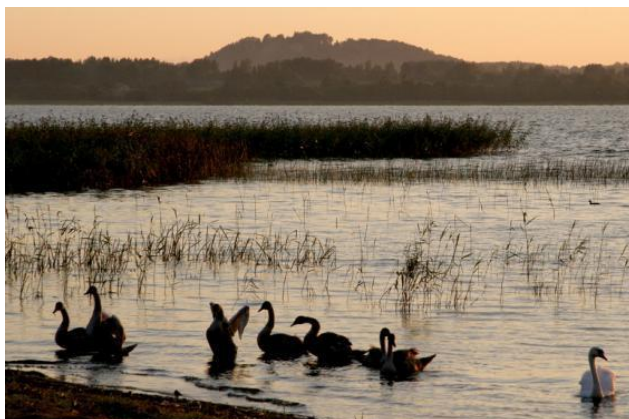
Gleznainais Rāznas ezers

Rēzeknes novads izceļas ar lielāko ezeru kopplatību valstī – novada teritorijā ir ap 200 ezeriem, tai skaitā Latvijas lielākie ezeri – Rāzna un Lubāns, kas ir arī nozīmīgākie zivsaimniecības ezeri Latvijā.