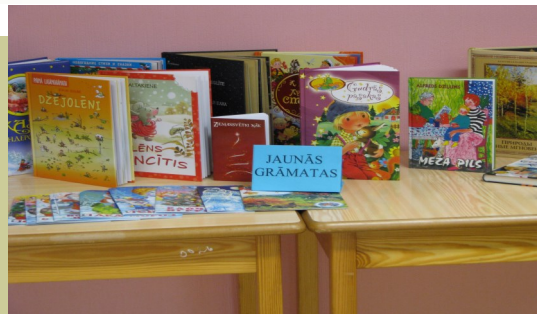
Informāciju sagatavoja: Z.Alberhta

Neskatoties uz to, ka visiem lielākajiem gadskārtu pasākumiem tiek piešķirti līdzekļi dalībnieku cienāšanai, konkursu uzvarētāju un labāko zīmējumu autoru balvām, diemžēl apmeklētāju skaits nav visai liels. Gribētos, lai bērni, īpaši 5-7 kl. skolēni, būtu aktīvāki un sekotu pasākumu paziņojumiem, kuri regulāri tiek izvietoti uz informācijas stenda.