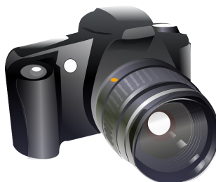
FOTO PLENĒRS RĒZEKNES NOVADĀ