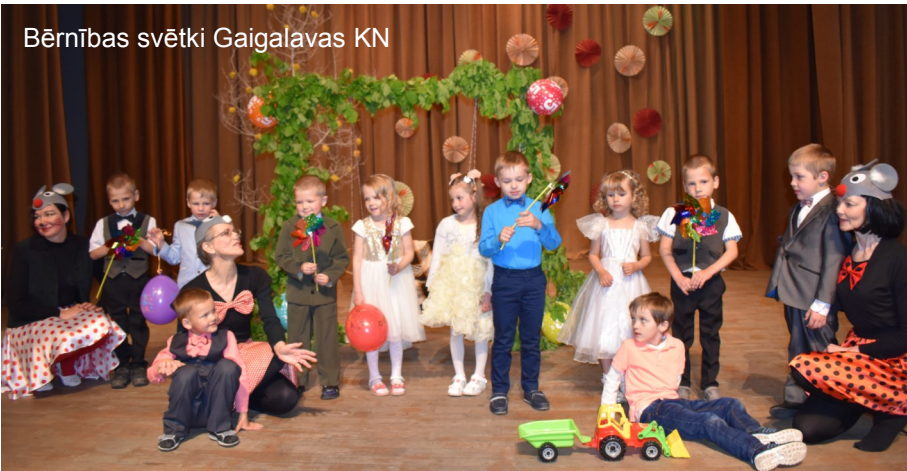
Bērņības svētki Gaigalavas KN