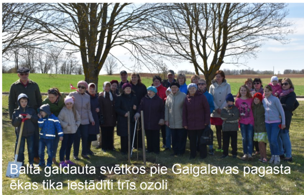
Baltā galdauta svētkos pie Gaigalavas pagasta ekas tika iestādīti trīs ozoli