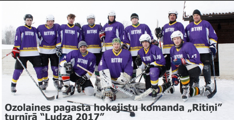
Ozolaines pagasta hokejistu komanda „Ritini” turnīrā „Ludza 2017”

Sestdien, 11. februārī, Ludzas pilsētas slidotavā virvoja hokeja kaislības. Te norisinājās Ludzas novada atklātais hokeja turnīrs „Ludza 2017”, kas sākotnēji bija plānots 21. janvārī, bet atkalas dēļ tika pārcelts. Soreiz laika apstākļi nepievēla. Par uzvaru cīnījās piecas komandas.