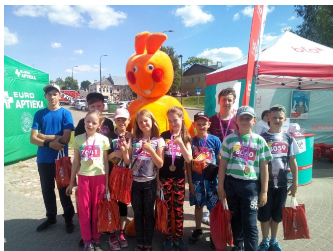
Rēzeknes pusmaratons- 2018

Tūjā, pie jūras. Skolēni saņēma Patriota pasi, kas apliecina, ka viņi ar cieņu un lepnumu nesa un arī turpmāk nesīs Rikavas skolas vārdu pasaulē!