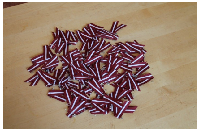
Indra Dzenes teksts