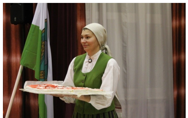
L.Ratnika tekstS