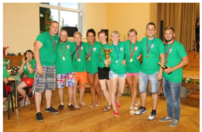
M. Krasnobajas un M. Bērtiņas teksts