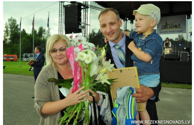
M. Krasnobajas un M. Bērtiņas teksts

Sirsniņgs paldies visām ģimenēm! Jūs esat mūsu pagasta lepnums! Lai Jums pietiek sirds siltuma, labsirdības, izturības un neatlaidības darot ikdienas darbus un palīdzot arī citiem!