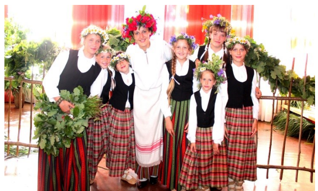
M. Krasnobajas teksts