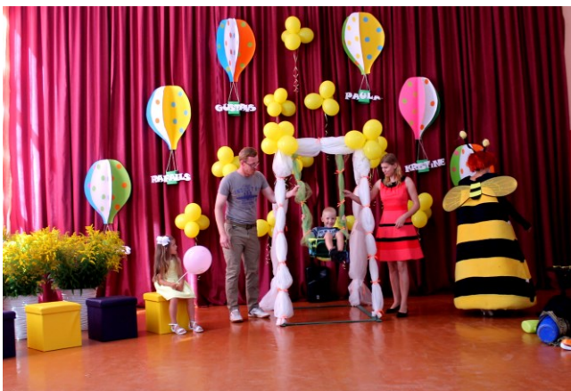
M. Šadurskas teksts