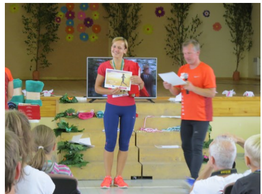
M. Šadurskas teksts