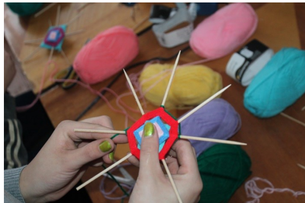
M. Krasnobajas teksts un foto