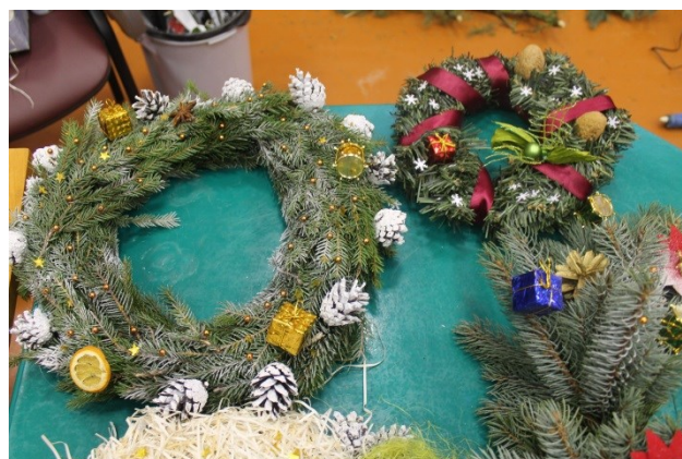
M. Krasnobajas teksts un foto