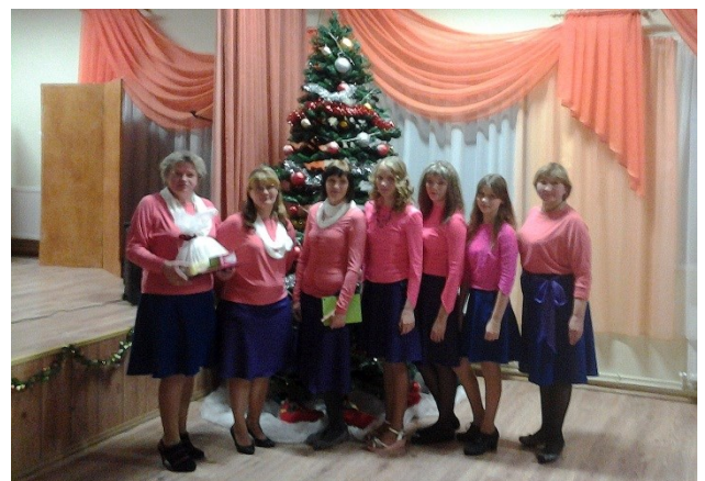
M. Krasnobajas teksts

Pēdējā adventes svētdienā, kad savos adventes vainadziņos iededzam ceturto eņģeļa svečīti, Čornajas tautas namā notika adventes koncerts. Tajā piedalījās arī Pušas TN vokālais ansamblis „Vuolyudzeitis”, kurš klausītājus priecēja ar mīļām un sirsnīgām Adventes un Ziemassvētku dziesmām.