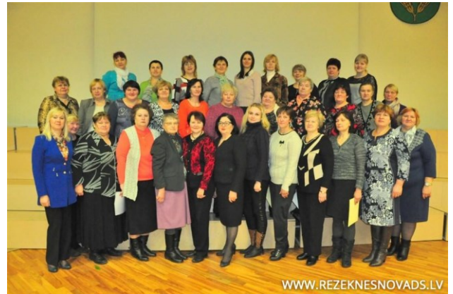
M. Bērņiņas teksts un foto

Jāatzīmē, ka akreditācijas komisija vērtēja bibliotēku sakārtotību, krājuma daudzveidību, dokumentāciju, darba un pasākumu plānus, attīstības koncepciju, kā arī bibliotēkas vadītāju saskarsmi ar apmeklētājiem. Pārējās 17 Rēzeknes novada bibliotēkas akreditācijas apliecības saņēma jau pagājušajā gadā, līdz ar to šobrīd 30 novada bibliotēkas ir veiksmīgi akreditētas uz turpmākajiem pieciem gadiem.