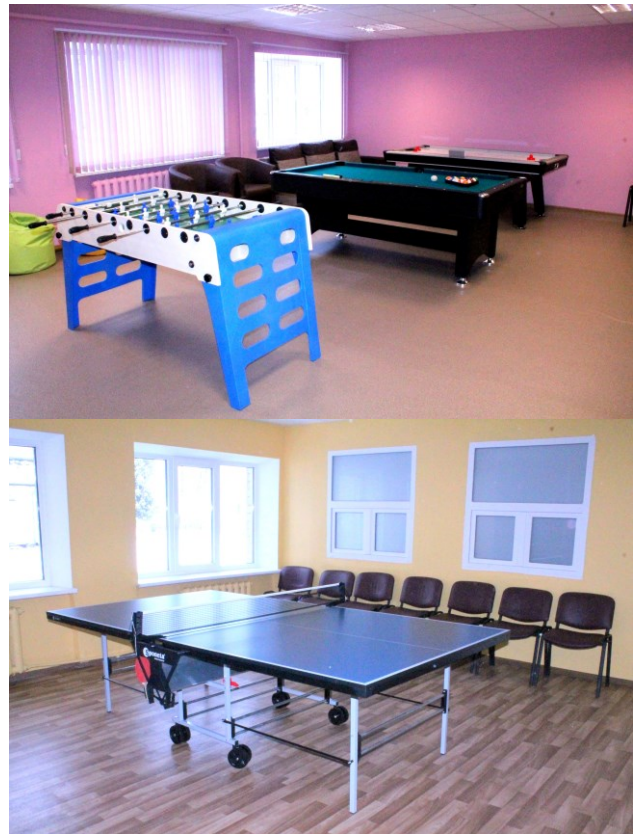
M. Šadurskas teksts un foto

Projekta attiecināmās izmaksas ir EUR 2115,00 no kurām publiskais finansējums ir EUR 1903,50. Līdzfinansējumu EUR 211,50 nodrošināja pašvaldība.