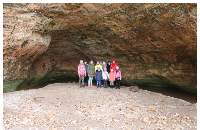
M. Šadurskas teksts un foto