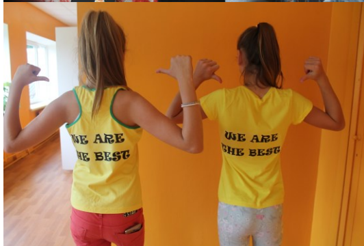
M. Šadurskas teksts un foto