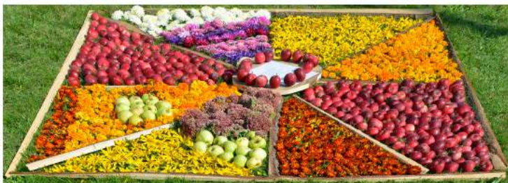
Ināra Paramonova