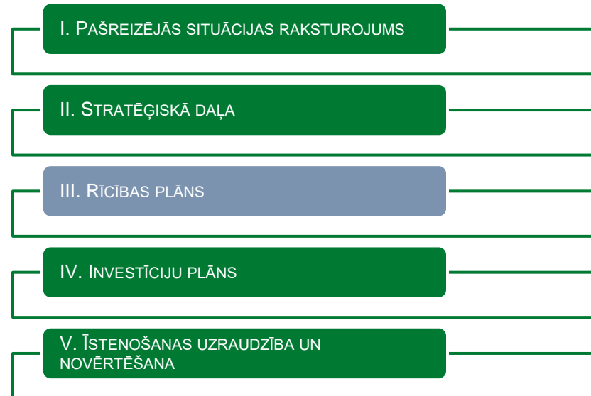
1. ATTĒLS. ATTĪSTĪBAS PROGRAMMAS DAĻAS

Rīcības plānu pašvaldība var aktualizēt ne retāk kā reizi gadā, ņemot vērā tā īstenošanas virzību un kārtējā gada apstiprināto pašvaldības budžetu, nemainot Attīstības programmas Stratēģisko daļu.