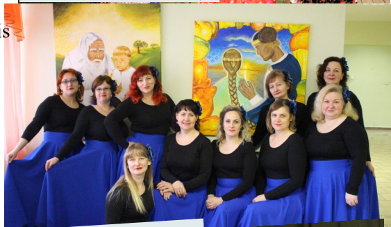
DG "I-Deja"