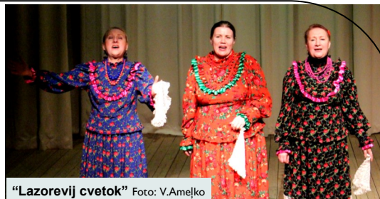
"Lazorevij cvetok"

Paldies visiem par pavasarīgo noskaņojumu un pozitīvo enerģiju!