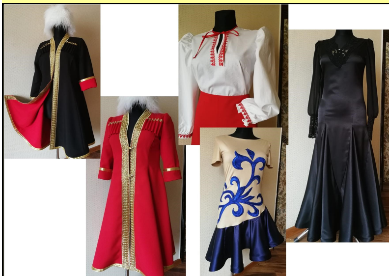
DK "Fazira" skatuves tērpi