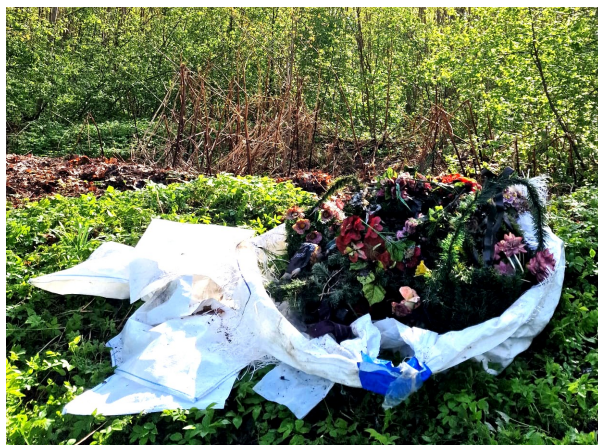
Informāciju apkopoja Dina Šmaukstele