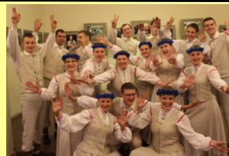
Jaunrades skatē Rēzeknes Kultūras namā