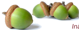
Ināra Blinova Folkloras kopas „Zeīļa” vadītāja

Aicinām visus hokeja atbalstītājus braukt uz Rēzeknes novada kausa izcīņu hokejā, kas notiks Daugavpils ledus hallē, un turēt īkšķus par RITIŅU HOKEJISTU KOMANDU. Izbraukšana š.g. 16.aprīlī plkst.11:30 no pagasta ēkas Bekšos.