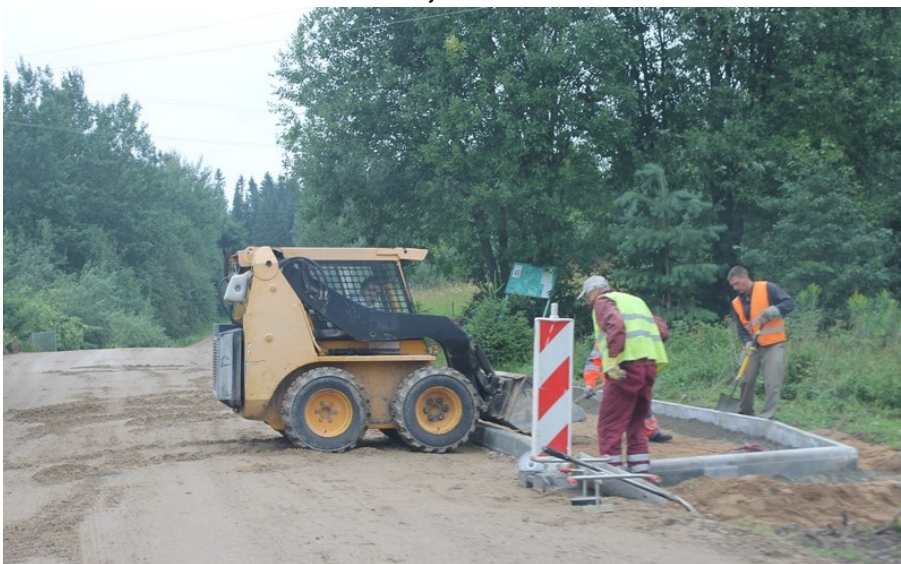
Notiek autobusu pieturu izbūves darbi Dzirksteles ielā