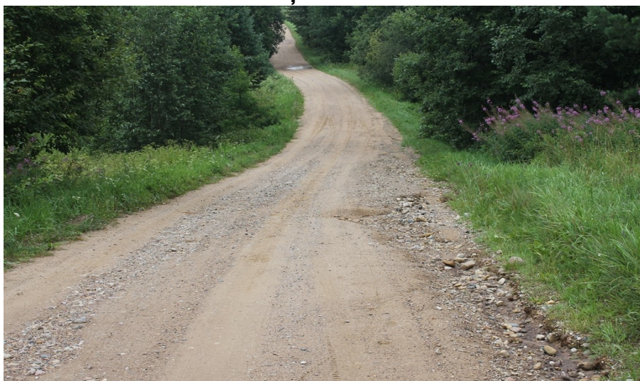
Viens no izskalotajiem grants ceļiem: Balbiši-Gaiduļi- Rubuļi-Usvīši