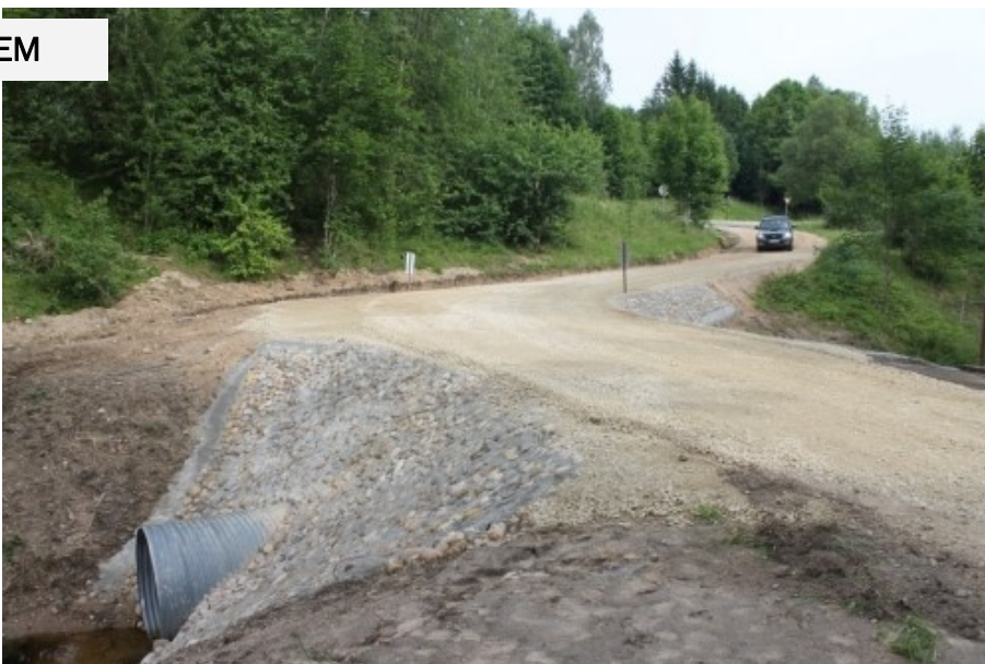
Caurtekas ierīkošana ceļam Bumbiški- Kivki-Balbiši

Jūlija vidū atsākas darbi pie Dzirksteles ielas pārbūves - 20. un 21.jūlijā tiek atkārtoti nosprausta ceļa trase un noritēs darbs pie autobusu pieturu izbūves darbiem. Jūlija beigās veikti šķembu slāņa izbūves darbi. Virsmas apstrādes darbu izpildes laiks vēl tiks precizēts. Dzirksteles ielas remontdarbus pēc iepirkuma „Dzirksteles ielas (posmā no Centrālās ielas līdz Griškānu pagasta robežai – 1,4 km garumā) ciems Pleikšņi, Ozolaines pagasts, Rēzeknes novads, pārbūve” rezultātiem veic SIA „Ceļi un Tilti”. Remontdarbu kopējā summa sastāda 103 267,48 EUR (bez PVN) . Jautājumos par Ozolaines pagasta ceļiem griezties pie galvenā speciālista saimnieciskajos jautājumos - Jura Runča, mob. 27870687.