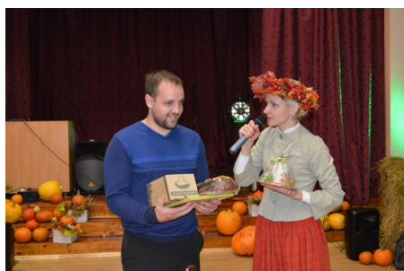
Koncerta laikā tika oficiāli noslēgts

Plkst. 19:00 svinības turpinājām ar svētku koncertu. Gribam teikt lielu paldies mūsu ciemiņiem- līnijdeju kolektīvam "Chilli Cha Cha" no Mežvidiem, tautu deju kolektīvam "Kūzuls" no Verēmiem un Čigānu ansamblim "Čargir" no Griškāniem, kas priecēja mūs gan ar dažādu žanru dejām, gan lustīgām, skanīgām dziesmām, radot patiesi krāšņu priekšnesumu karuseli Ražas svētku koncertā.