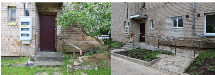
Ieeja pirms projekta