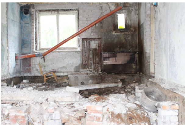
Telpa pirms projekta