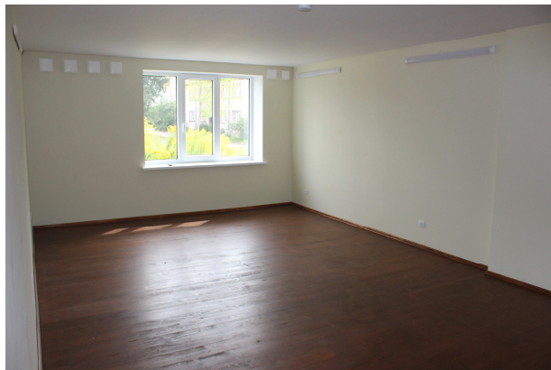
Telpa pēc projekta pabeigšanas

izbūvēta uzbrauktuve, lai objekts būtu pieejams personām ar kustību traucējumiem. Būvniecības darbus veica SIA "INTECO WOOD". Oktobrī centrā tiks uzstādīti 3 kardiotrenažieri un 2 daudzfunkcionālie treniņi fiziskajām un veselību veicinošajām aktivitātēm. Projekta attiecināmās izmaksas ir 20 000 euro, no kurām 18 000 euro ir ES finansējums un 2000 euro Vērēmu pagasta pārvaldes līdzfinansējums.