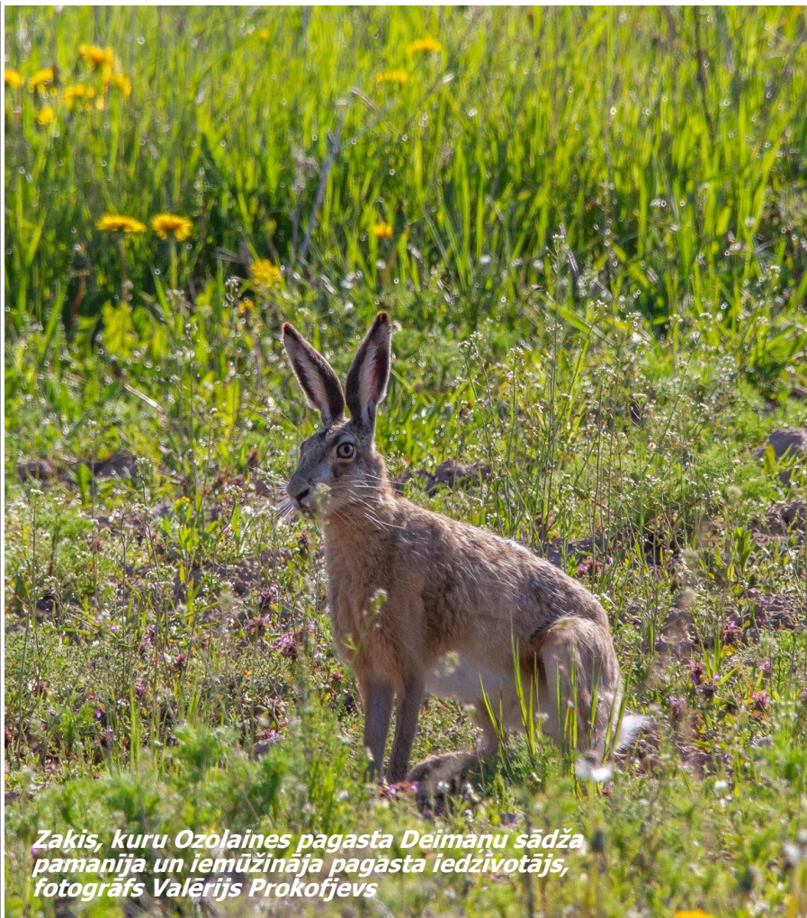
Zaķis, kuru Ozolaines pagasta Deimaņu sādza pamanīja un iemūžināja pagasta iedzīvotājs, fotogrāfs Valērijs Prokofjevs

Stedzamos gadījumos iedzīvotājus aicinām izmantot diennakts tālrunu numurus: 110, 112.