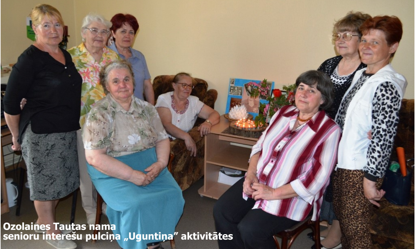
Ozolaines Tautas nama senioru interešu pulciņa „Uguntiņa” aktivitātes

„Covid-19” laikā seniori īpaši tika aicināti ievērot pašizolāciju, līdz ar ko mēs bijām spiesti atrasties mājās, censties uztvert situāciju ar vēsu prātu, izprast notiekošo un zināt, ko darīt ļoti smagajos brīžos.