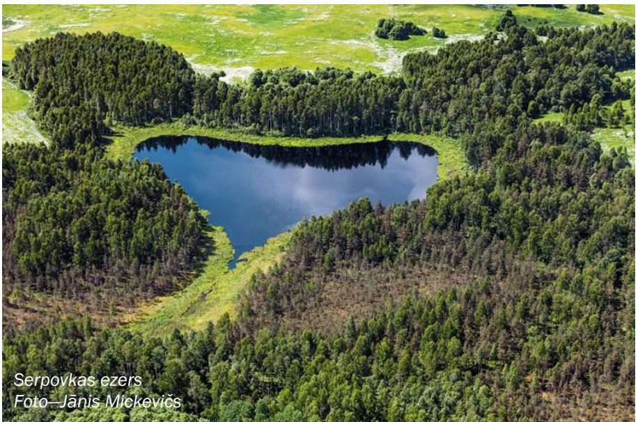
Serpovkas ezers

Aleksejs Smirnovs Rubļovu dzimtas pēcnācējs nasledie_lex@rambler.ru