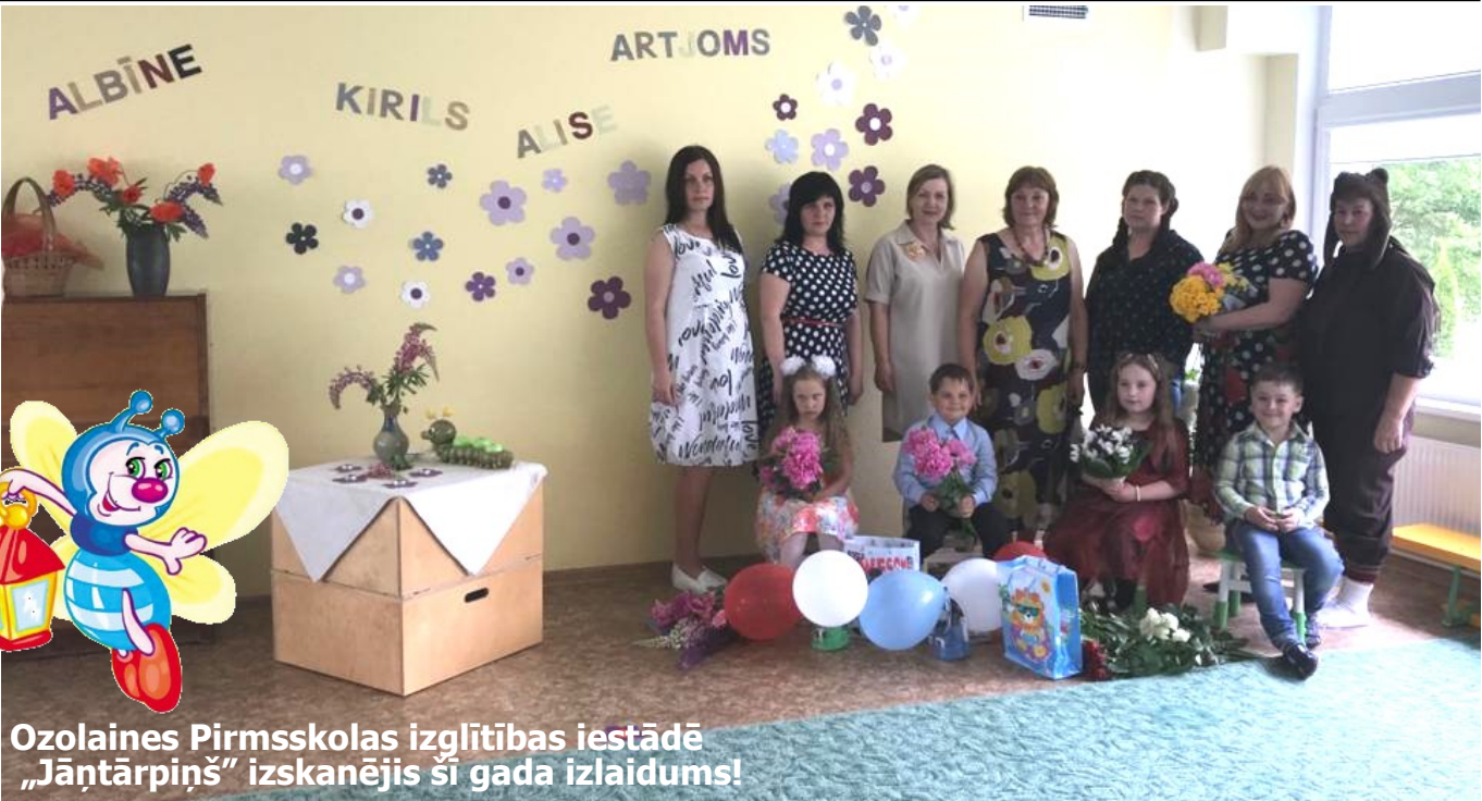
Ozolaines Pirmsskolas izglītības iestādē „Jāntārpiņš” izskanējis šī gada izlaidums!

Lai gan notikumi pasaulē šogad izjauca ierasto notikumu gaitu, bērnudārzs ne uz mirkli nepārtrauca savu darbību, un, kā jau vienmēr, notika arī sešgadnieku izlaidums. Pirmais izlaidums ir īpaši svētki gan bērniem, gan viņu vecākiem. Mazais bērns pēkšņi izaudzis jau tik liels un gatavs doties skolas gaitās, bet jūs, mīļie vecāki, noteikti vēl kā vakar atceraties sava bērna pirmos soliņus, pirmos vārduņus, pirmās asaras... Bet, kā jau mēs zinām, laiks taču mīl steigties, steigties un nu ir aizsteidzies līdz šim skaistajam brīdim, - izlaidumam. Ik mirkli priecāsimies par bērnu sasniegumiem, jo viņiem tie ir ārkārtīgi svarīgi, lieli un nozīmīgi notikumi! Patiess prieks bija redzēt jūs jau tik pieaugušus un atbildības