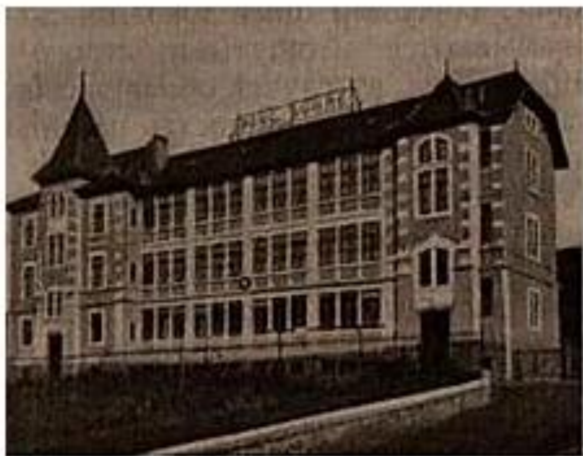
Фабрика в Швейцарии