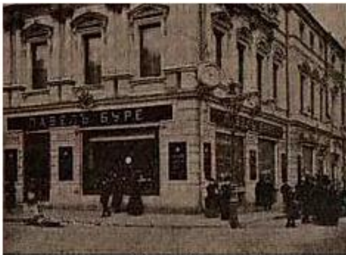
Магазин в Москве