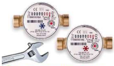
Замена счетчиков воды

Силмалское волостное управление просит всех пользователей воды проверять свои счетчики воды, поскольку большинство из них были поставлены в июне, июле, августе 2016 года, и в связи с тем, что счетчики необходимо проверять раз в четыре года, в этом году пришло время устанавливать другие проверенные счетчики, которые будут работать 4 года - до 2024 года.