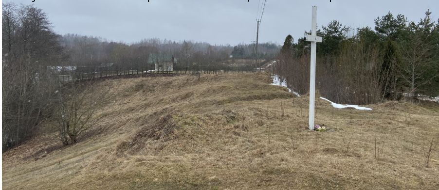
Vietējās nozīmes kultūras piemineklis -Gaiduļu viduslaiku kapsēta