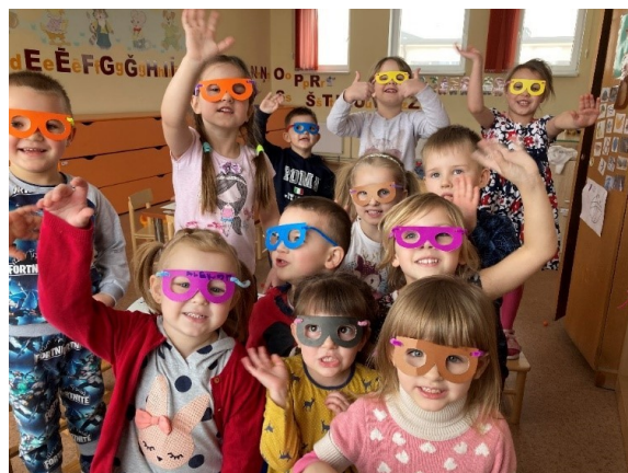
Prieks pēc padarītā darba!

Arī sagatavošanas grupas „Sprīdiši” bērniem šajā ziemā darba pietiek. Bērni ar neatlaidību apgūst