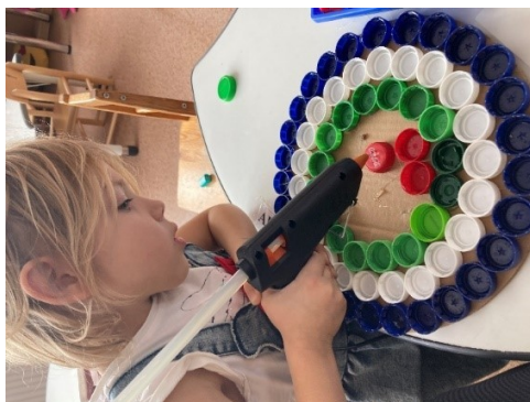
Paklājīņa tapšanas process

Grupā „Bitītes” , atbilstoši skolas nestajam MammaDaba vēstniecības statusam, bērni savā radošajā darbībā izmanto arī mājās sastopamos otrreizējās lietošanas materiālus. Tā no pudeļu korkiņiem tapa ortopēdiskie paklājīni, ko bērni paši nu jau izmanto gan brīvajos brīžos, gan arī nodarbībās.