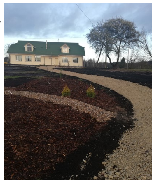
Informāciju sagatavoja Laimdota Melne