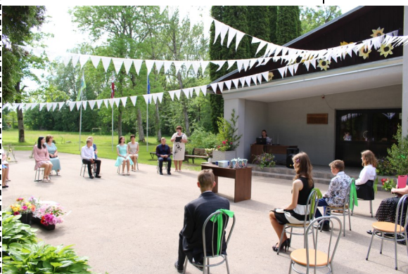
Izlaidums pie Feimaņu pamatskolas