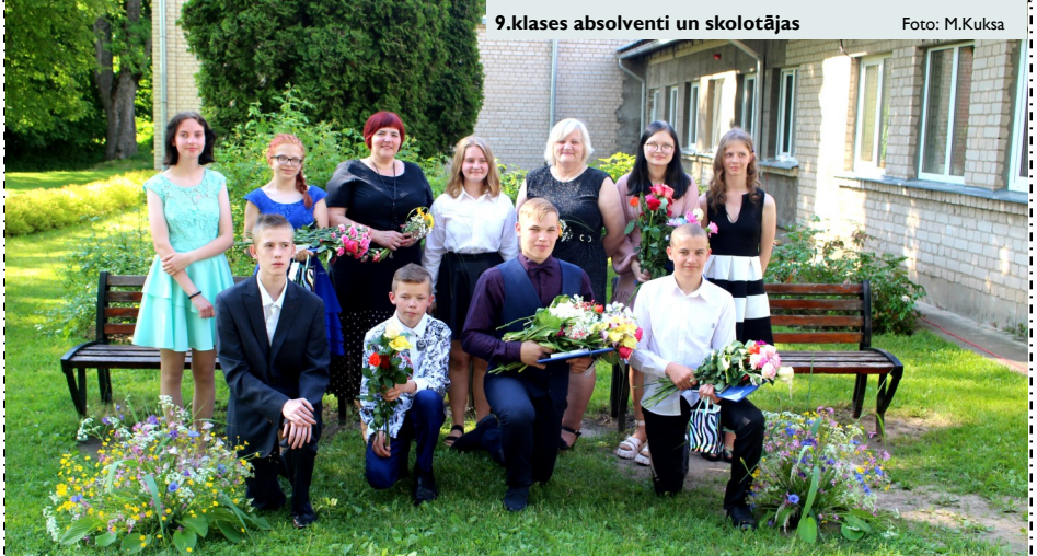
9.klases absolventi un skolotājas

Izlaiduma klases audzēkņus ar muzikāliem priekšnesumiem sveica viņu skolas biedri