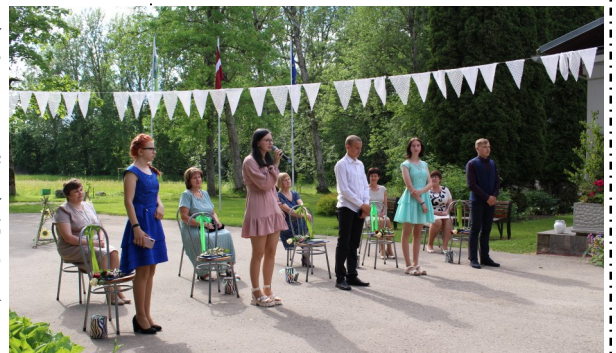
9.klases absolventi un skolotāji