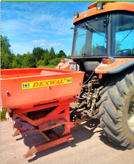
Tehnika darbu veicot