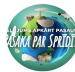
CEĻOJUMS APKĀRT PASAULEI. PASAKA PAR SPRĪDĪTI.

skolēniem ar mūzikas starpniecību tiks izstāstīta mūsdienu versija pasakai par Sprīdīti, jo skolēni devās interaktīvā "Ceļojumā apkārt pasaulei", sastopoties ar dažādu valstu kultūru un to saikni ar Latvijas vēsturi Pasaules ģeogrāfijas un vēstures kontekstā, tā ļaujot labāk izprast dažādu valstu valodas, kultūras.