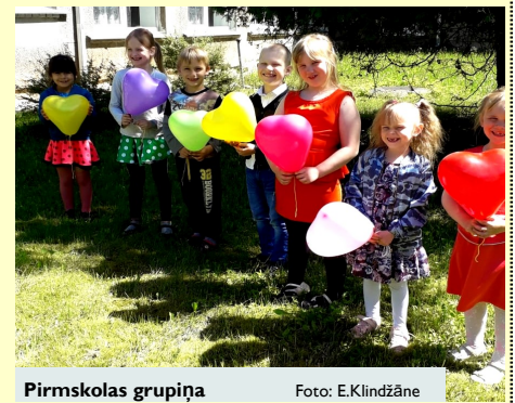
Pirmsskolas grupiņa