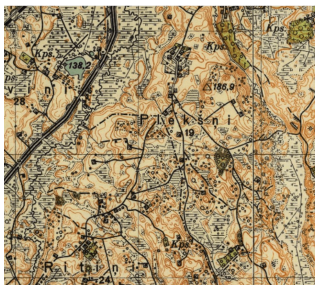
1920-1940.gada Latvijas armijas karte