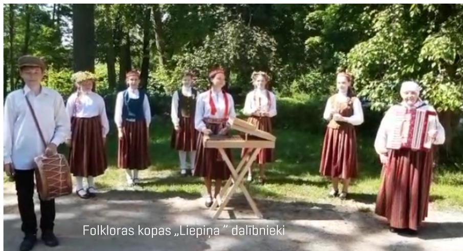
Folkloras kopas „Liepiņa” dalībnieki