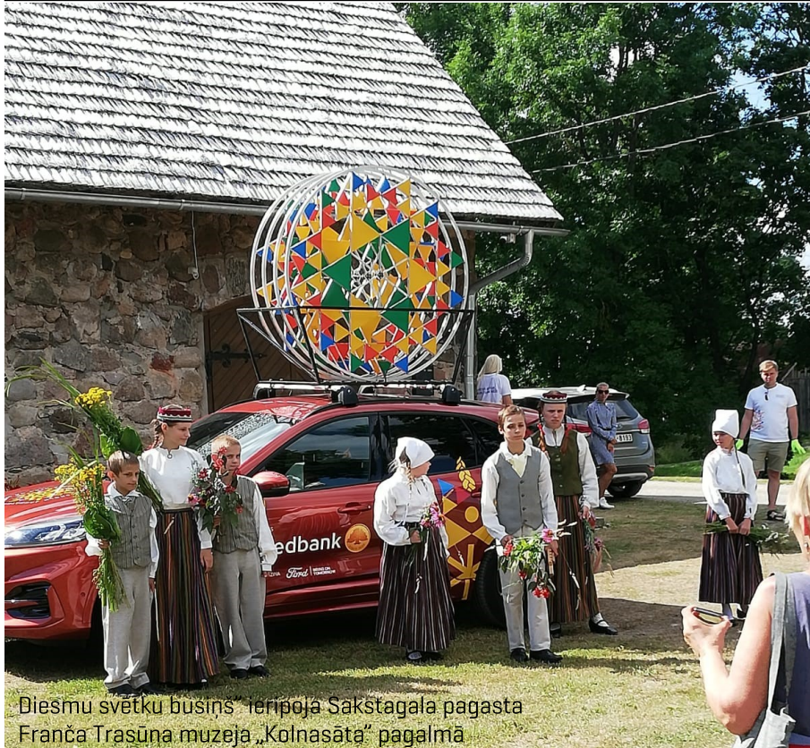
Dziesmu svētku busiņš ierīpoja Sakstagala pagasta Franča Trasūna muzejā „Kolnasātā” pagalmā