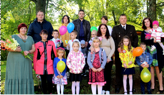
Pirmklasnieki ar skolotāju un vecākiem