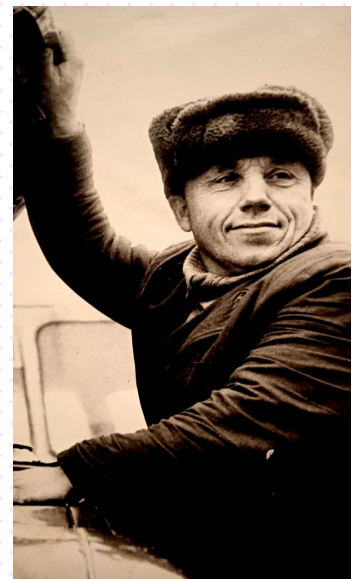
A.Smironovs Foto no ģimenes arhīva

Andrians īpašās skolās nav izglītojies, bet viņam piemita jaunrades spējas, vienmēr kaut ko izgudrot, kaut ko salabot vai izveidot no jauna. Strādādams par šoferi, bieži