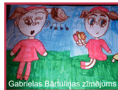
Gabriēlas Bārtuliņas zīmējums

Gaigalavas pagasta pārvaldes bezmaksas izdevums "Gaigalavas Ziņas".