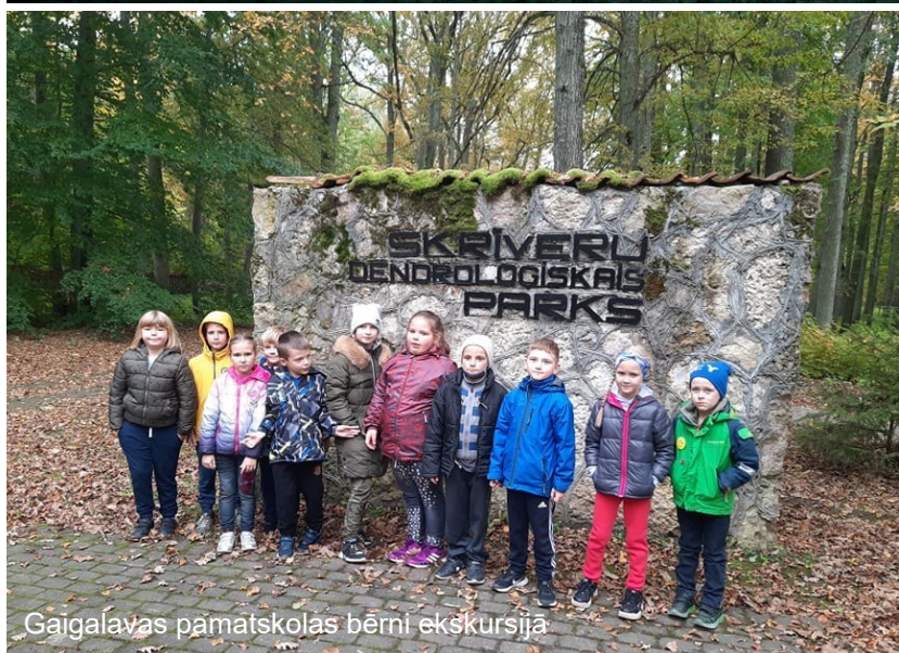
Gaigalavas pārnāskolas bērni ekskursijā

Dāvana Latvijai no Gaigalavas jauniešiem - atkritumu vākšana no Gaigalavas līdz Svētiņu ezeram