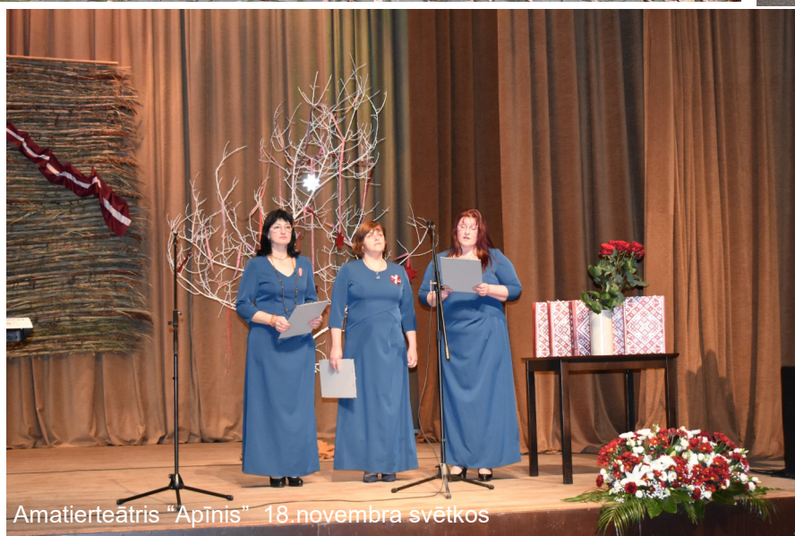
Amatierteātris "Apīnis" 18. novembra svētkos