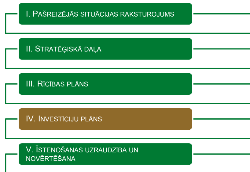
1. ATTĒLS. ATTĪSTĪBAS PROGRAMMAS SADAĻAS

Aktualizēto Investīciju plānu apstiprina ar Rēzeknes novada domes lēmumu.