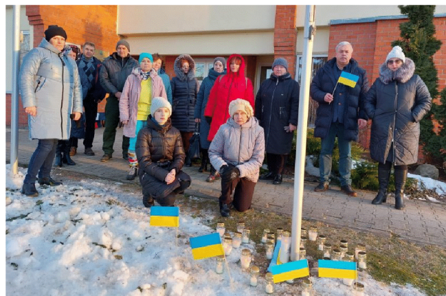
Kaunatas iedzīvotāji pauž atbalstu Ukrainas tautai