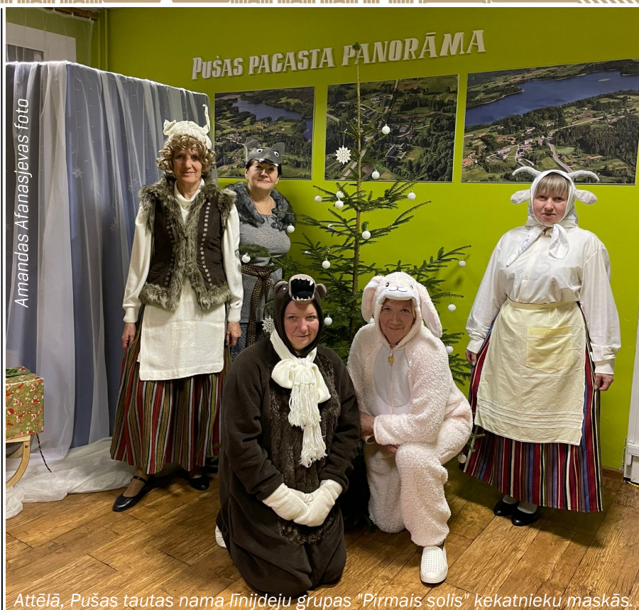
Amandas Afanasjevas foto