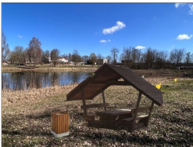
Atpūtas stūrītis pie Kalnu ielas dīķa