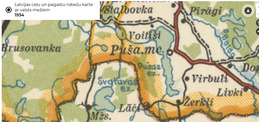
Latvijas ceļu un pagastu robežu karte ar valsts mežiem 1934

Varbūt tieši tāpēc Svätovas ezers ir īpašs. Nevis ar rekordiem vai skaļiem notikumiem, bet ar spēju savienot dažādus laikus vienā stāstā. Senais