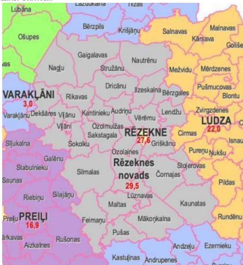
Attēls nr. 1

Pēc PMLP datiem (uz 01.01.2021) Rēzeknes novadā pavisam kopā dzīvo 4332 jaunieši vecumā no 7-17 gadiem (ieskaitot), no kuriem visvairāk bērnu un jauniešu dzīvo Maltas pagastā (304 jaunieši), bet vismazāk Nagļu pagastā (31 jaunieši), bērnu un jauniešu skaitu Rēzeknes novada pagastos un pilsētā, skatīt 2.attēlā.