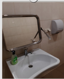
Personīgās higiēnas vieta