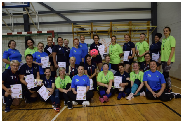
Informāciju sagatavoja Līvānu pagasta sporta pasākumu organizatore S.Mikanova