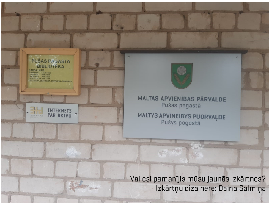
Vai esi pamanījis mūsu jaunās izkārtnes? Izkārtņu dizainere: Daina Salmiņa