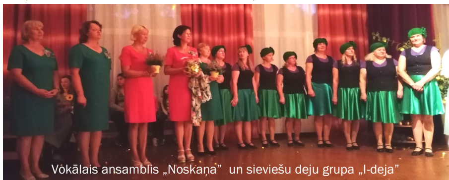
Vokālais ansamblis „Noskaņa” un sieviešu deju grupa „I-deja”