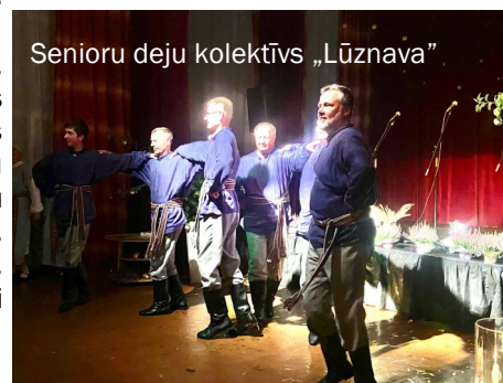
Senioru deju kolektīvs „Lūznava”