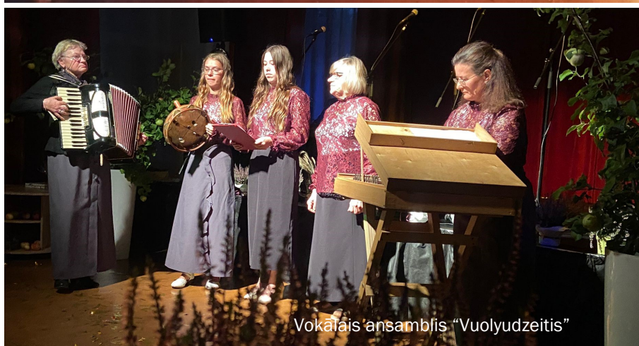
Vokālais ansamblis „Vuolyudzeitis”