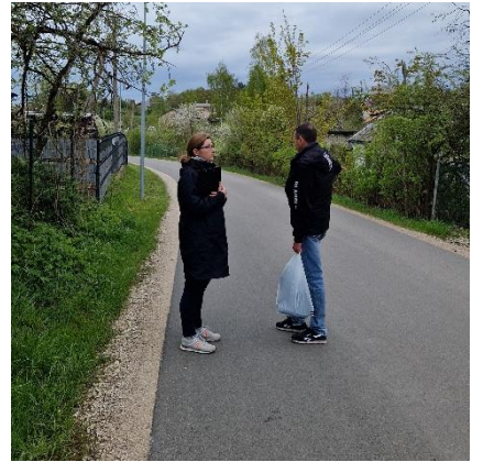
Attēls 2: Ieskats interviju īstenošanas procesā