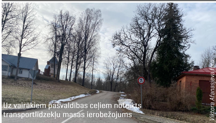
Uz vairākiem pašvaldības ceļiem noteikts transportlīdzekļu masas ierobežojums