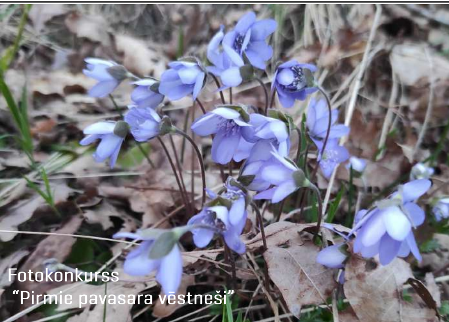
Fotokonkurss "Pirmie pavasara vēstneši"

Virtuālās fotoizstāde un balsošana par uzvarētājfotogrāfiju notiks laika posmā no 02.05.- 08.05. Īpašnieks fotogrāfijai, kas saņems visvairāk atzīmju "Patīk", tiks apbalvots!