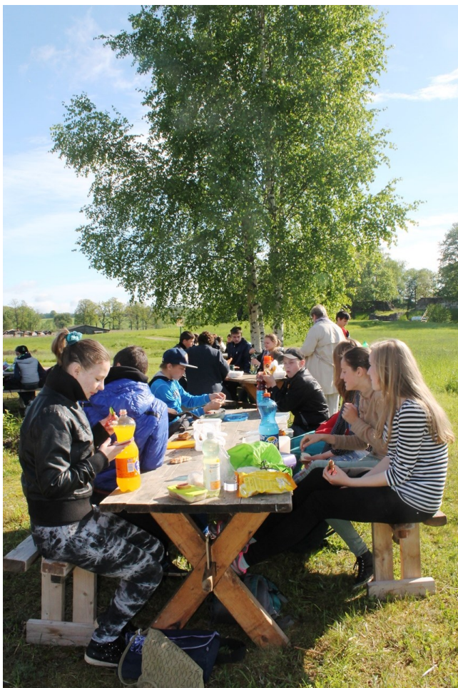
GAIDOT EKSKURSIJAS GIDU UZ ĀRAIŠU EZERPILI