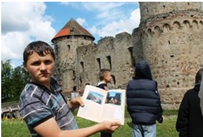
IGORS ATRADIS LĪDZĪBAS GRĀMATAS BILDĒ UN DABĀ

FOTOGRĀFIJAS UN RAKSTU SAGATAVOJA VĒSTURES SKOLOTĀJA S. LAIZĀNE.