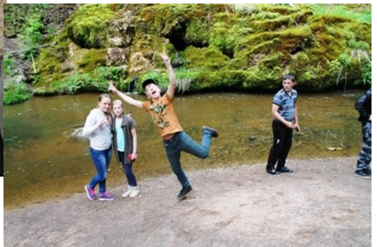
PIE RAUNAS STABURAGA

FOTOGRĀFIJAS UN RAKSTU SAGATAVOJA VĒSTURES SKOLOTĀJA S. LAIZĀNE.