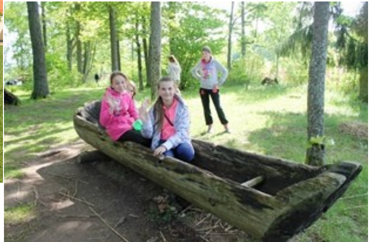
MARIKA UN MARIJA VIENKOCĪ MEITU SALĀ