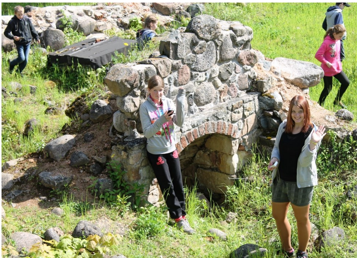
MADARA UN ANNA ĀRAIŠU MŪRA PILS PALIEKĀS