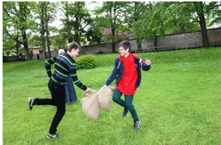
RŪDIS UN EDIS VIDUSLAIKU BĒRNU SPĒLĒ