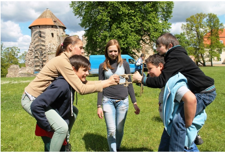
KURŠ UZVARĒS VIRVES VILKŠANAS SACENSĪBĀS?