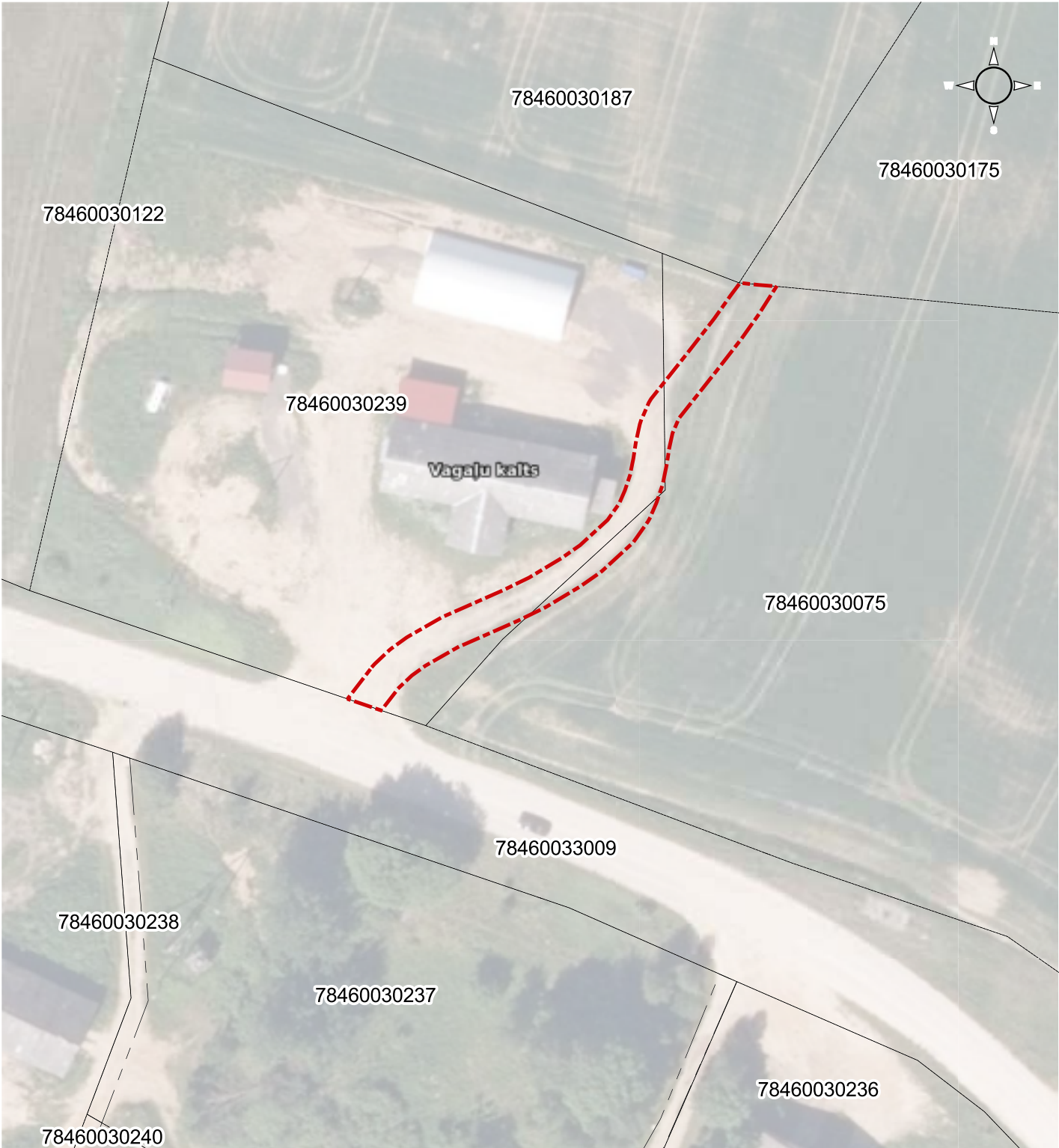
Ceļa servitūta izvietojuma zemes vienībās ar kadastra apzīmējumu 7846 003 0239 un 7846 003 0075 shēma