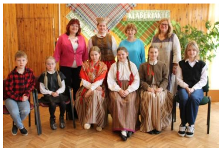
Stāstnieku konkurss “Teci, teci valodiņa” (34 dalībnieki, no tiem 26 Rēzeknes novada skolēni; I pakāpes diploms - 24 skolēniem, II pakāpes diploms – 2 skolēniem)