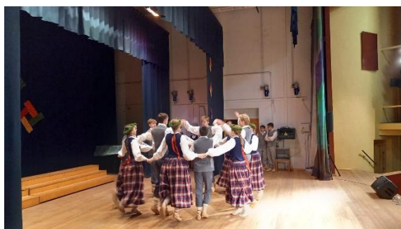
Tautas deju kolektīvu radošais koncerts – repertuāra pārbaudes skate (piedalījās 11 deju kolektīvi)