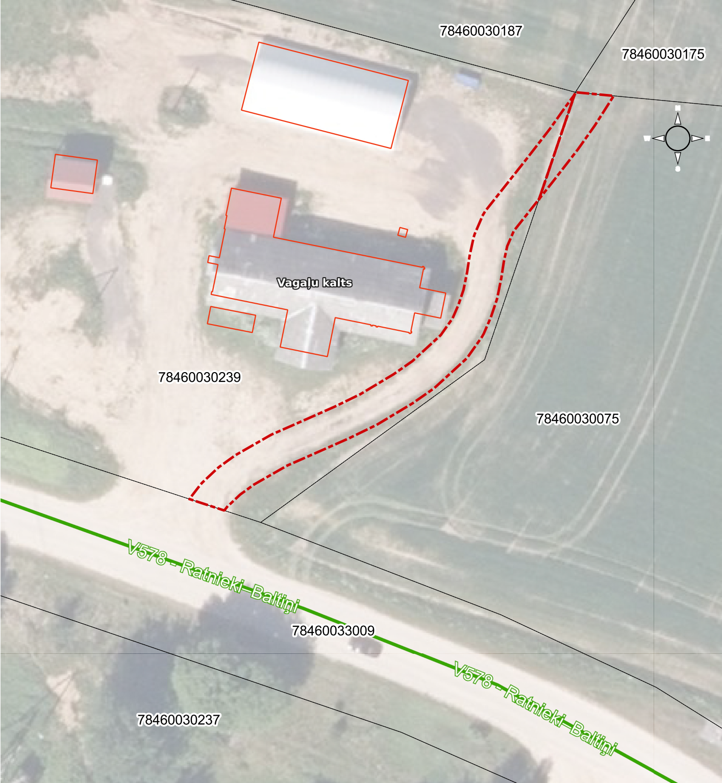
Ceļa servitūta izvietojuma zemes vienībās ar kadastra apzīmējumu 7846 003 0239 un 7846 003 0075 shēma

"Par grozījumu izdarīšanu Rēzeknes novada domes 06.02.2025. gada 6. februāra lēmumā Nr.123 "Par ceļa servitūta nodibināšanu pašvaldībai piekritīgā zemes vienībā ar kadastra apzīmējumu 7846 003 0239 Čornajas pagastā""